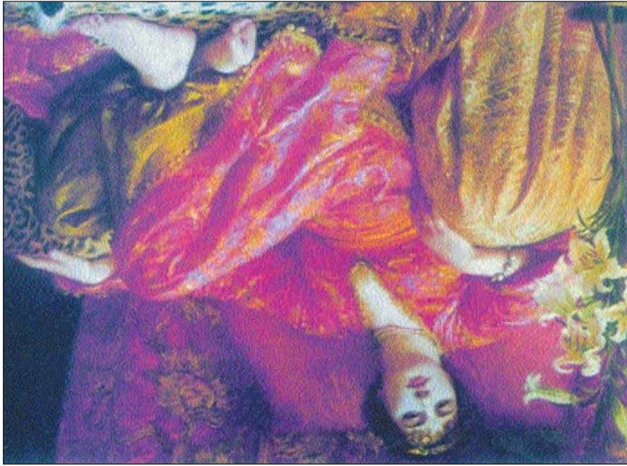
1892 "The Girl" by John Singer Sargent