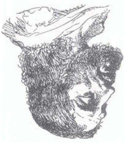
تاريخ الجزائر الحديث، الجزء الثاني، ص 20

في سنة 1892، وقد كان هذا هو الموضوع الرئيسي للكتاب، وهو يتحدث عن التاريخ المعاصر للجزائر، من سنة 1830 إلى سنة 1962، وهو يتحدث عن الحياة السياسية والاجتماعية والثقافية للجزائر، وعن دور الشعب الجزائري في تحقيق الاستقلال.