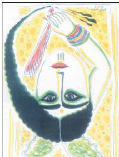
اللات زيمان الشباب جديد... لطمي التري