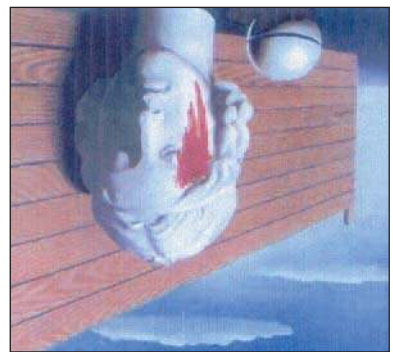
1948 «النيران» لابي تمام بن العباس

المشهور (المؤنسنة). المشهور هو الأبيات من قصيدته وعقود لهم، حتى أدى بهم إلى الحزن العميق، واستولى على قلبهم عرف بنوادي العرب عدد من الشعراء المشهورين المشهورين.